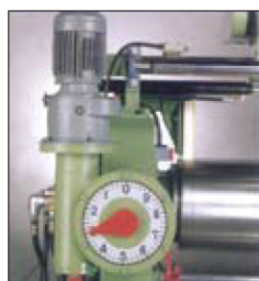
■間隔調整は電動式 ※オプション