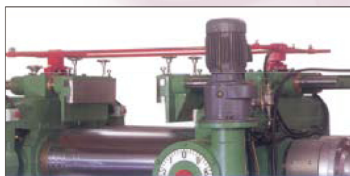
■巾寄せは油圧式 ※オプション