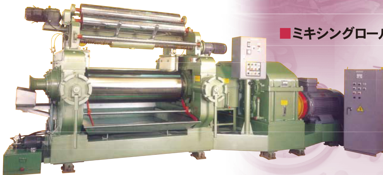
■ミキシングロール